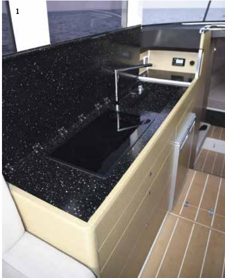
1. Die 165 cm lange Pantry mit Ceranfeld, Spüle und Kühlschrank 2. Sanitärraum mit elektrischer Toilette, Waschbecken und Dusche 3. Aufwendig realisierte innenliegende Ankerinstallation am XO-Bug 4. Ideal zugängliche Mercury-Turbodiesel vom Typ V8 TDI 370 4,2 L 5. Das Glasdach öffnet auf Knopfdruck und vermittelt Cabrio-Feeling 6. An Steuerbord: 35 cm breites Laufdeck, flankiert von einer Schanz